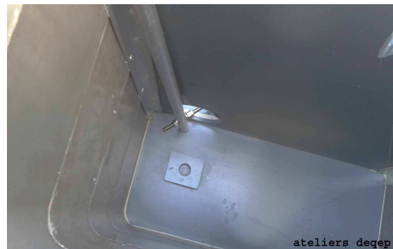
Bonde de vidange ouverte

munie d'une bonde Ø 110 mm en partie basse pour vidange du canal d'approche ;