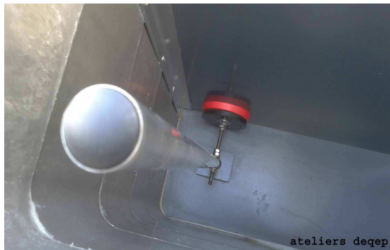
Bonde de vidange fermée